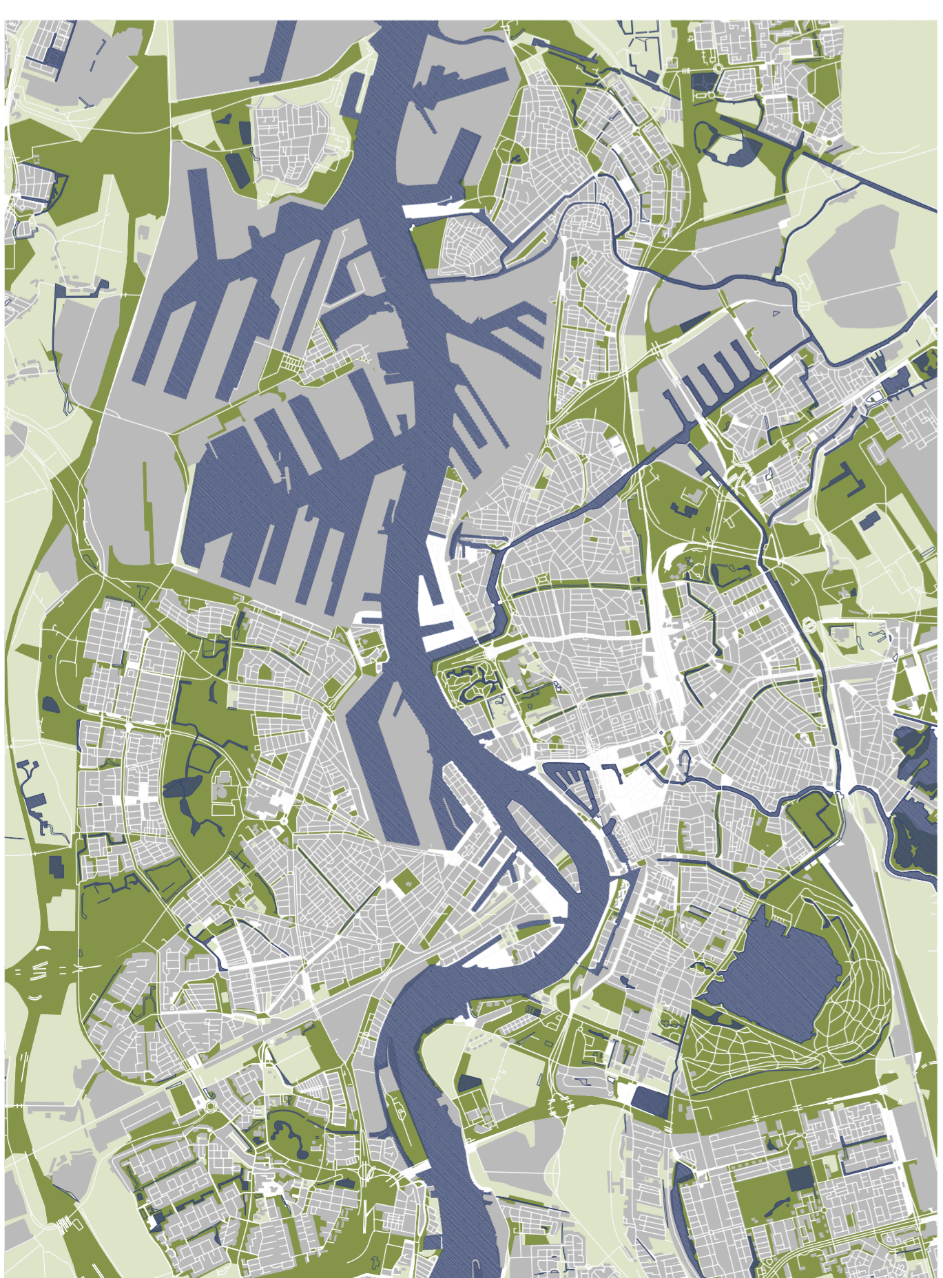
XARXA ESPAIS VERDS e 1/40000