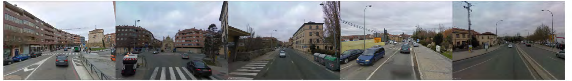
alrededor de la carretera de San Rafael/Madrid e: 1/1500