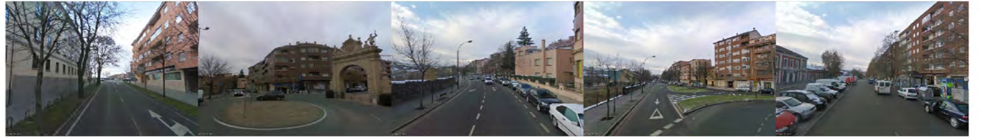
alrededor de la carretera de Villavieja e: 1/1500