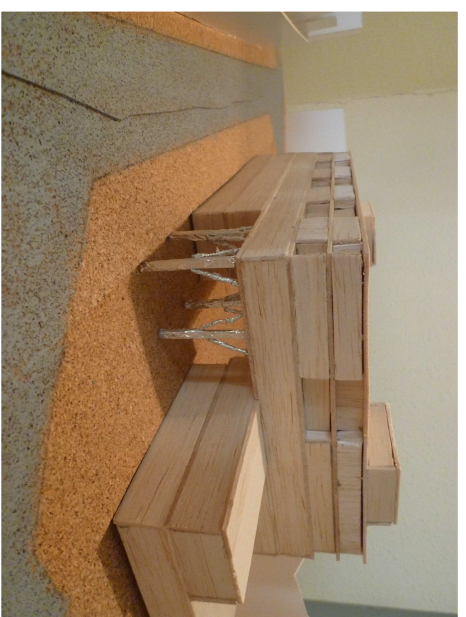
PASSATGE DEL MERCAT