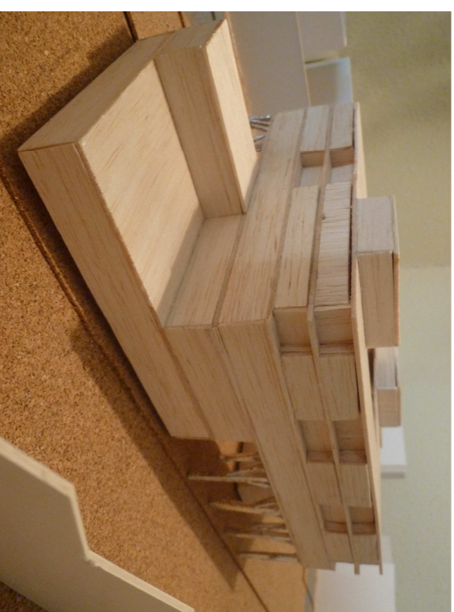
OBERTURA AL MERCAT