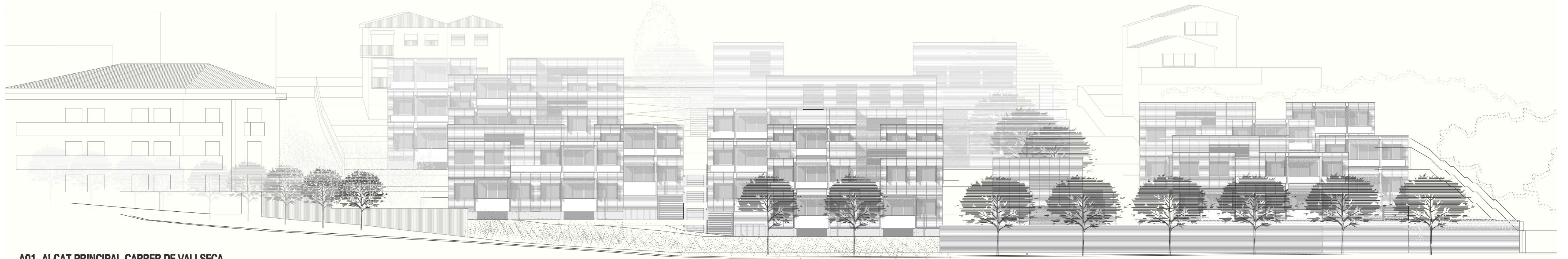
A01. ALÇAT PRINCIPAL CARRER DE VALLSECA