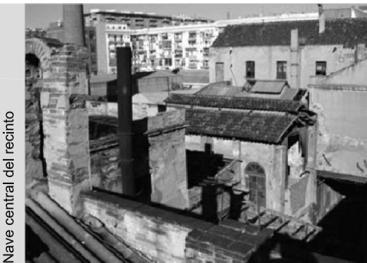
Nave central del recinto