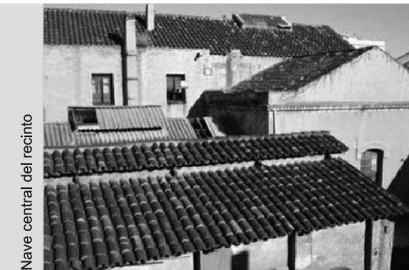
Nave central del recinto