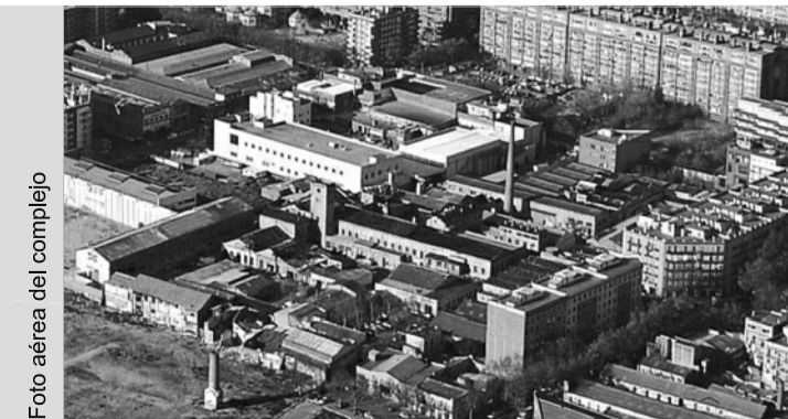
Foto aérea del complejo