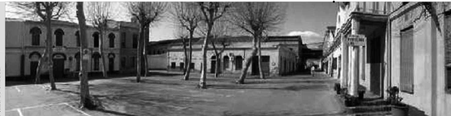
Plaza de entrada