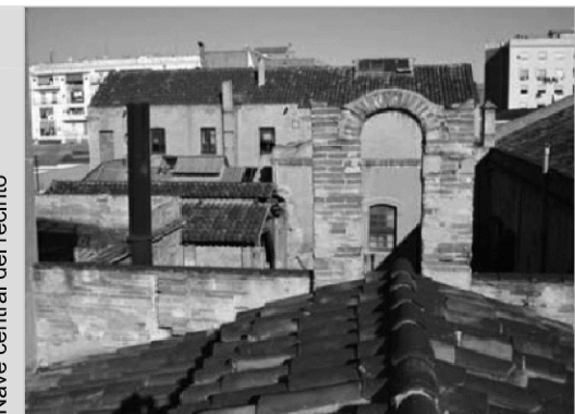
Nave central del recinto