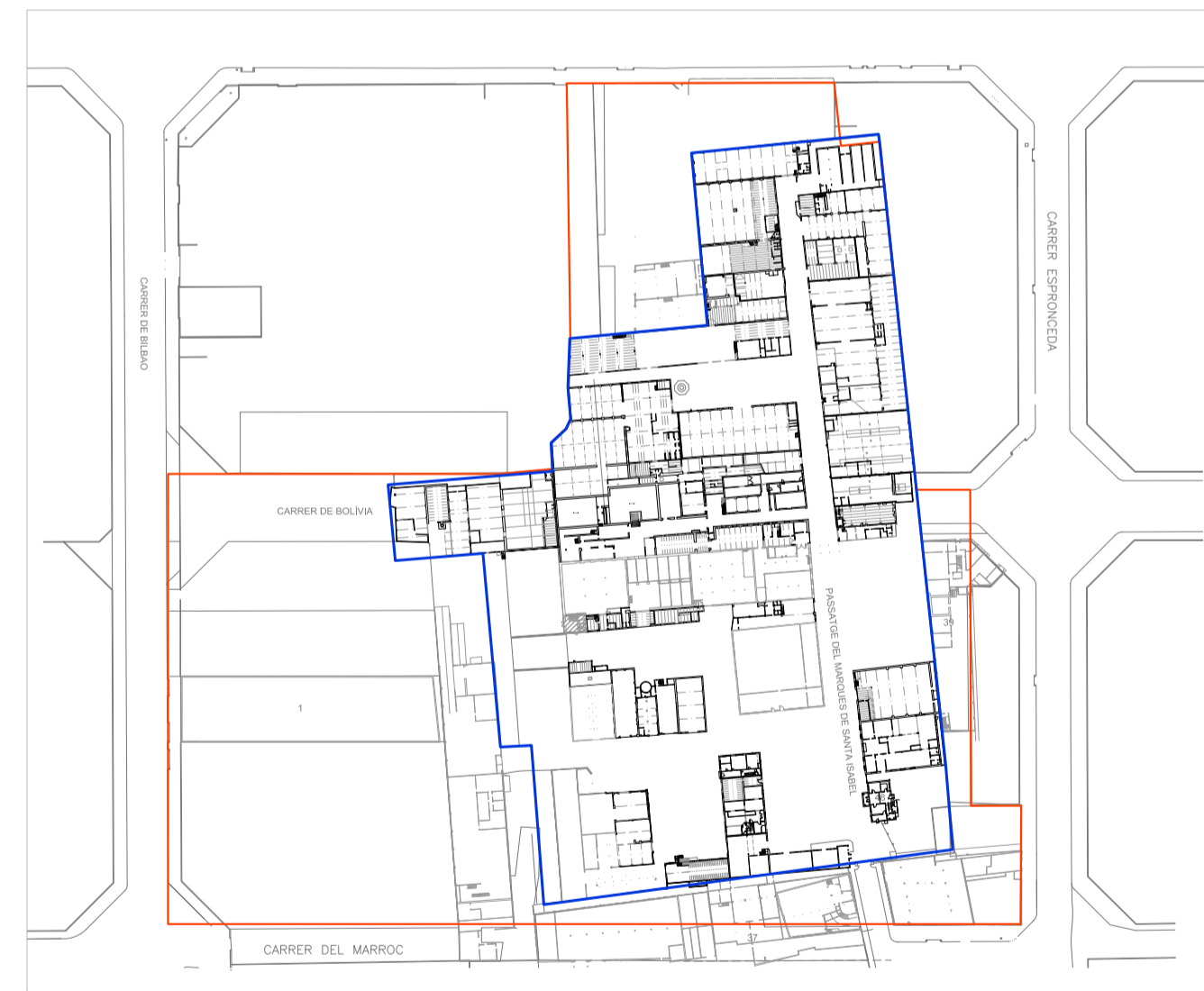
Ambito UA-1 Ambito Can Ricart esc. 1/2000