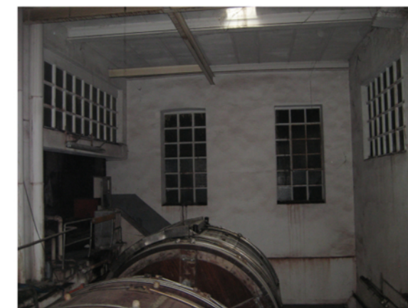
H=4,7m Estructura de formigó armat amb jàsseres acartellades Forjats ceràmics de volta d'arc rebaixat Antigues oficines