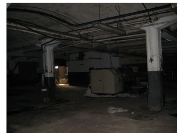
H=4,1m Estructura de formigó armat amb jàsseres acartellades Forjats ceràmics de volta d'arc rebaixat Accés principal des de façana sud