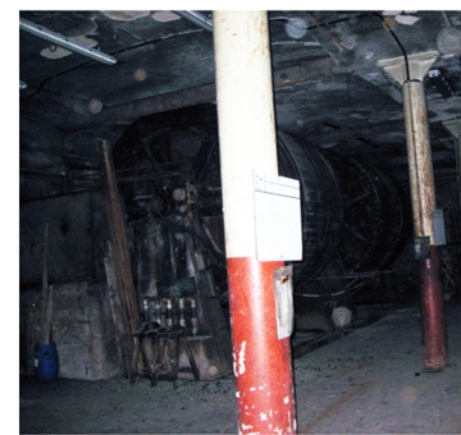
H=4,7m Estructura a base d'arcs rebaixats ceràmics i pilars de forja Forjats ceràmics de volta d'arc rebaixat S'incorporen tirants per controlar l'arc de descàrrega Accés 2 des del carrer del Sol