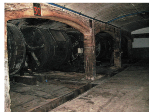
H=4,1m Estructura a base d'arcs rebaixats de formigó i pilastres de maó Forjats ceràmics de volta d'arc rebaixat No llum natural - soterrani