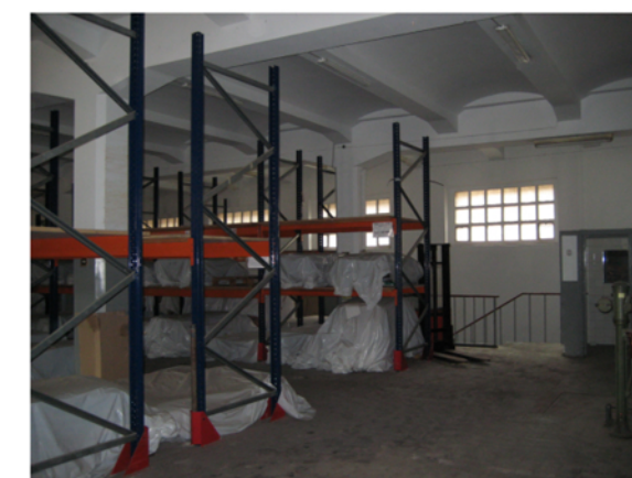
H=4,7m Estructura de formigó armat amb jàsseres acartellades Forjats de viguetes de formigó armat acartellades i revoltons creàtics