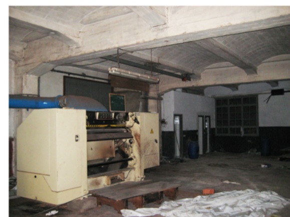
H=4,1m Estructura de formigó armat amb jàsseres acartellades Forjats de viguetes de formigó armat acartellades i revoltons creàtics Accés des de façana sud