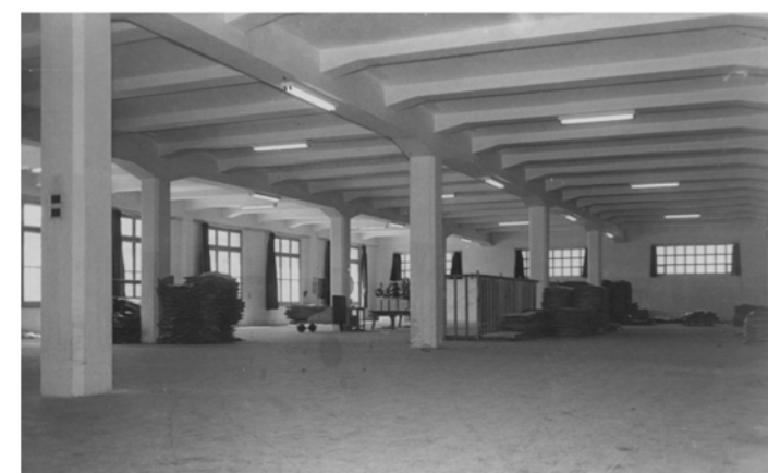
H=4,7m Estructura de formigó armat amb jàsseres acartellades Forjats de viguetes de formigó armat acartellades i revoltons creàtics